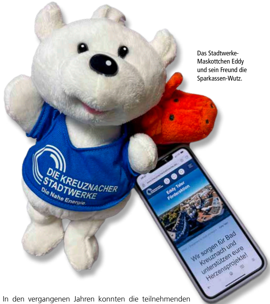
Das Stadtwerke-Maskottchen Eddy und sein Freund die Sparkassen-Wutz.

Passend zur Urlaubszeit steht im Juli eine ganz besondere Aktion auf dem Plan: Gesucht werden Sehenswürdigkeiten in Bad Kreuznach, die als Bilderrätsel gelöst werden müssen.