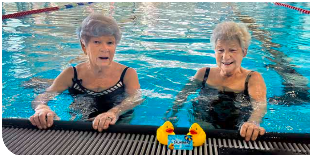
Die sportlichen Damen schwimmen nicht nur, meist laufen sie auch zum Salinenbad. „Heim geht's dann mit dem Bus“, verraten sie uns mit einem Augenzwinkern.