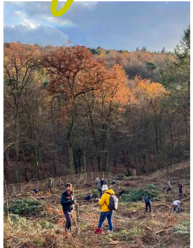
Die Stadtwerke setzen auf Bäume, die mit dem Klimawandel gut zurechtkommen – wie Traubeneiche, Esskastanie, Baumhasel und Elsbeere.

Mehr Infos zur naheChangers App: www.nahechangers.de